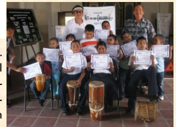
La Universidad patrocina el conjunto típico de la Fundación Natá de los Caballeros.

dad de vida de las comunidades”. Esta función esta consagrada en el Reglamento de Extensión Universitaria, y se evidencia con los programas que hemos realizado en función de identificarnos con los problemas de la sociedad.