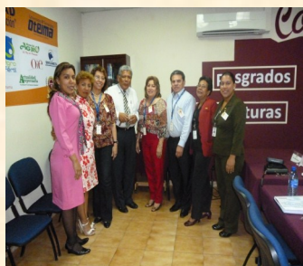
Los pares externos, observadores de la CTF y el personal directivo de la Sede Santiago.

Dentro de la agenda de los pares externos se contempló la visita de la Sede de Santiago de Veraguas.