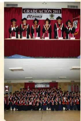
Ecós de la última promoción de la Universidad. Los directivos y los graduandos