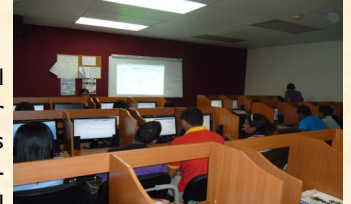
En una clase de Informática, se inducen a los estudiantes al uso de la plataforma tecnológica.

“Estamos convencidos de que el docente es uno de los protagonistas del proceso de enseñanza universitaria, y que gran parte de los resultados finales de una universidad se debe a los docentes”