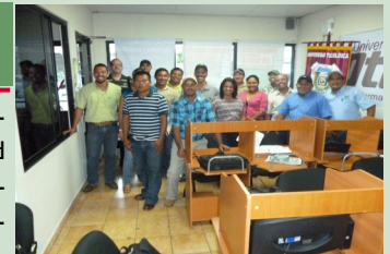
Técnicos del MIDA, reciben capacitación, en evaluación de proyectos agropecuarios

Este programa, constituye la proyección cultural de la universidad a todos los sectores de la sociedad, para responder a las necesidades de capacitación y desarrollo, lo cual es parte de nuestra responsabilidad.