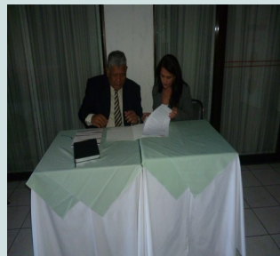
El Prof. Agrazal y la Licda Fernández, suscriben convenio