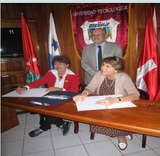
Rectoras de ambas universidades firman convenio.